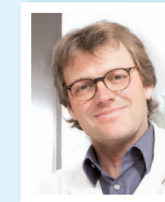
Dr. T. Schumacher Institut für Radiologie und Nuklearmedizin im Ev. Diakoniekrankenhaus Freiburg